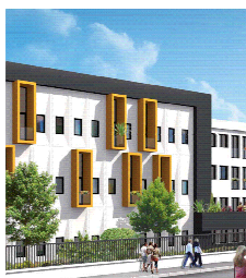
Rue Treich Laplene - LR

Lors de la séance du 22 décembre dernier, les sénateurs et députés sont tombés d'accord en Commission paritaire concernant les modalités du futur dispositif fiscal (loi Scellier ) destiné à remplacer les dispositifs ROBIEN et BORLOO concernant le marché de l'immobilier